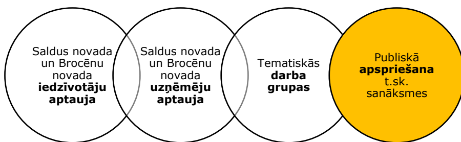
Attēls 2: Attīstības programmas izstrādes procesa galvenie sabiedrības līdzdalības iesaistes elementi

Laika posmā no 2021. gada 20.jūlija līdz 2.augustam tika organizētas attīstības programmas izstrādes tematiskās darba grupu sanāksmes 4 , kurās piedalījās gan iedzīvotāji, gan uzņēmēji, gan pašvaldības dažādu jomu speciālisti.