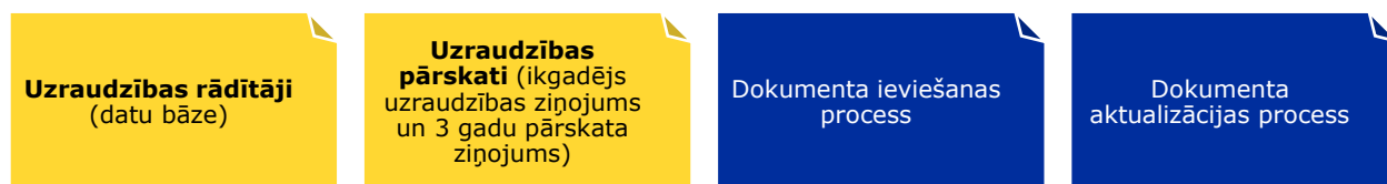
Attēls 2: Attīstības programmas uzraudzības sistēmas elementi

Lai tiktu nodrošināts tas, ka attīstības programma ir "dzīvs" dokuments, kas tiek pastāvīgi (ar noteiktu periodiskumu) aktualizēts, uzraudzības sistēma paredz kārtību, kādā dokuments tiek aktualizēts . Dokumenta atsevišķu sadaļu aktualizācija ir nozīmīga, ņemot vērā gan uzraudzības rādītājus, gan vietējās, reģionālas un starptautiskas tendences – tas nodrošina sekmīgāku stratēģisko uzstādījumu sasniegšanu ( skat. Attīstības programmas Stratēģisko daļu ).